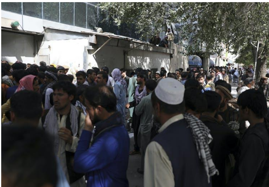
Ciudadanos hacen fila en los cajeros automáticos para retirar sus ahorros, Kabul, 15 de agosto de 2021.

Pero ahora es difícil, si no imposible, que esas personas huyan de un país bajo el dominio de los talibanes. Y los traductores están lejos de ser los únicos afganos que corren el riesgo de sufrir represalias por parte de los talibanes.