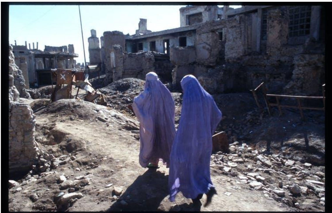
Mujeres en Kabul en 1996, durante la guerra civil.

Un maestro de escuela del norte de Afganistán dijo a los investigadores: “Al principio, cuando vimos las entrevistas de los talibanes en la televisión, esperábamos la paz, como si los talibanes hubieran cambiado. Pero cuando vi a los talibanes de cerca, no cambiaron en absoluto”.