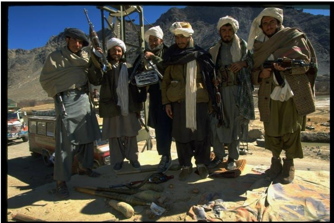
Unos guerrilleros talibanes, Afganistán, 1995.

Los talibanes – que significa ‘los estudiantes’ en pastún – tomaron el control de Afganistán en 1996 después de capturar Kabul en la guerra civil afgana. Establecieron un gobierno basado en su interpretación extrema de la ley islámica Sharia y gobernaron durante cinco años. El régimen talibán fue derrocado en 2001 por la invasión de Afganistán liderada por Estados Unidos.